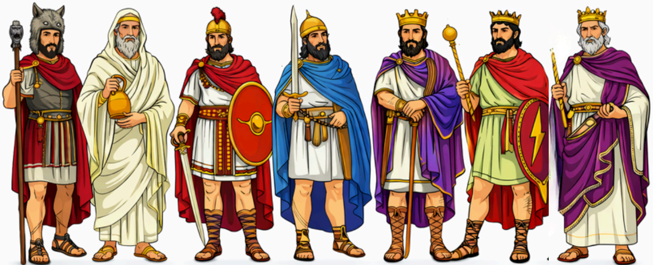
ROMOLO NUMA TULLO ANCO TARQUINIO SERVIO TARQUINIO POMPILIO OSTILIO MARZIO PRISCO TULLIO IL SUPERBO